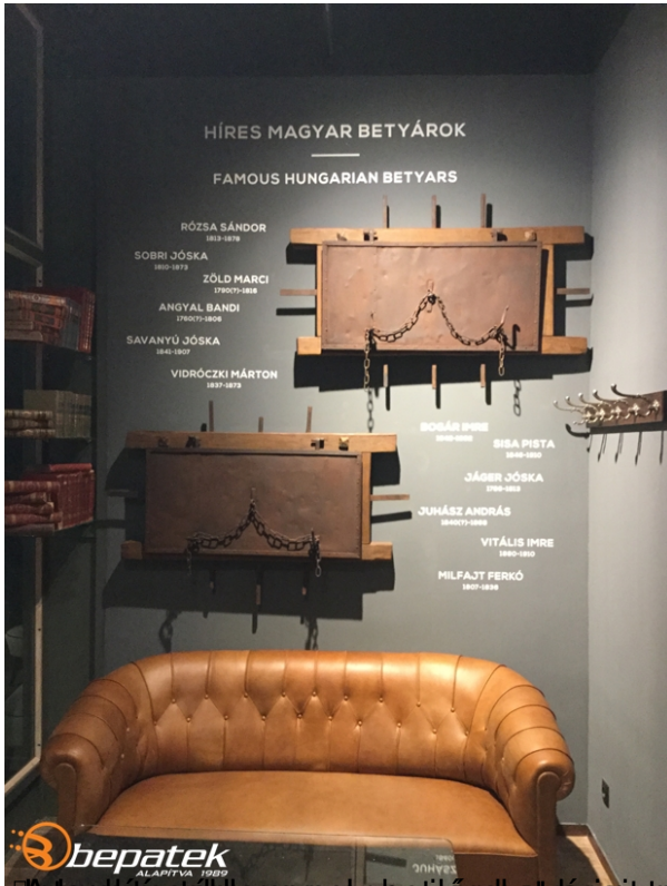
A legismertebb magyar betyár börtönből való ábratartója be.