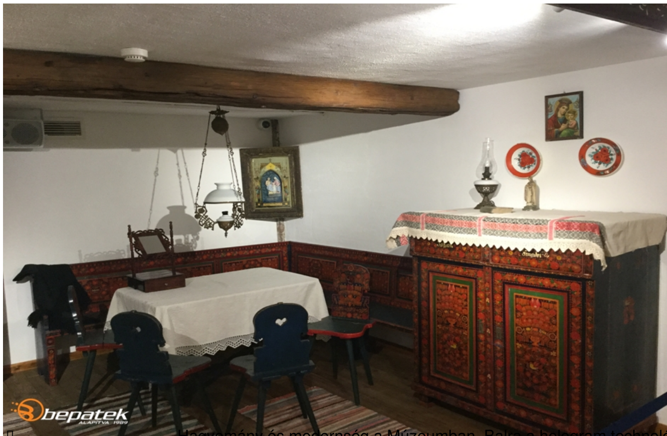
Hagyomány és modernség a Múzeumban. Balra a holnap technológiával kész