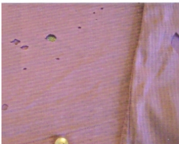
A sav lyukat üt a pólóba

Hiba: Ez a kabát meglehetősen jól nézett ki, amikor kiszedték a gépből, de a tulaj panasszal tért vissza, mivel halvány foltok voltak az egész ruhán. Ok: Ezek a foltok elég szabályosak voltak, a belső gomboknak, patentoknak és a belső varrásnak vették fel az alakját. Ha a jelzés nem lett volna eléggé alapos és körülhatárolt, akkor részben a viselő is okolható lett volna. Ebben az esetben a hiba okozója az ügyetlen mángorlás. Felelősség: A tisztítót terheli. Javítás: Nem lehetséges.