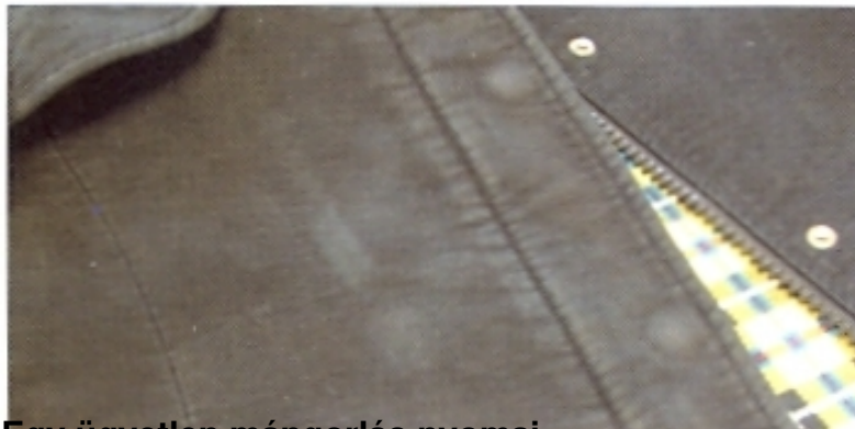
Egy ügyetlen mángorlás nyomai

Hiba: Ez a kabát meglehetősen jól nézett ki, amikor kiszedték a gépből, de a tulaj panasszal tért vissza, mivel halvány foltok voltak az egész ruhán. Ok: Ezek a foltok elég szabályosak voltak, a belső gomboknak, patentoknak és a belső varrásnak vették fel az alakját. Ha a jelzés nem lett volna eléggé alapos és körülhatárolt, akkor részben a viselő is okolható lett volna. Ebben az esetben a hiba okozója az ügyetlen mángorlás. Felelősség: A tisztítót terheli. Javítás: Nem lehetséges.